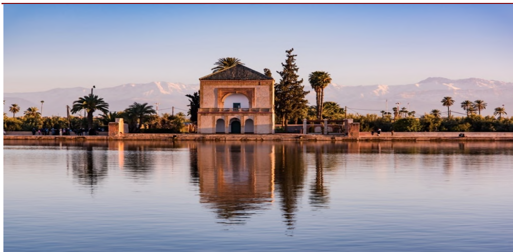
Particolare Giardini Menara

Prima colazione in hotel. Intera giornata dedicata alla visita di Marrakech , la città rossa del paese e la seconda città imperiale più antica dopo Fes fondata dagli Almoravides alla fine del XI secolo. La Proseguimento delle visite con la Moschea Koutoubia , i Giardini Menara , Le tombe saadiane e il Palazzo Bahia . Pranzo. Nel pomeriggio visita dei souk e quartieri di artigiani. Fine delle visite con una sosta nella famosa Piazza Djemaa El Fna . Rientro in hotel, cena e pernottamento.