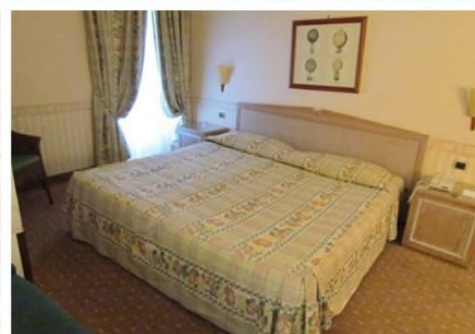
Quote scontate per persona sistemazione camera standard nel trattamento prescelto