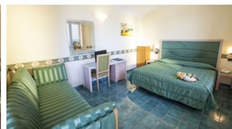
Quote per persona e per periodo sistemazione in camera Standard